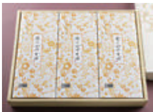
⑥ かけそば 3人前 2,490円