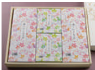
⑦ ざるそば 2人前 + にしんそば 2人前 3,500円