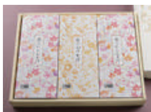
⑤ かけそば 1人前 + にしんそば 2人前 3,170円