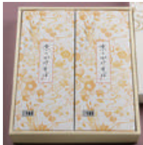
⑪ かけそば 2人前