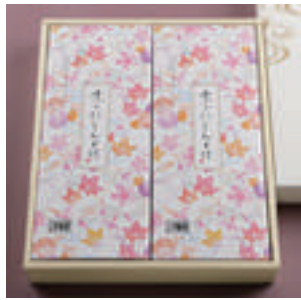
⑨ にしんそば 2人前