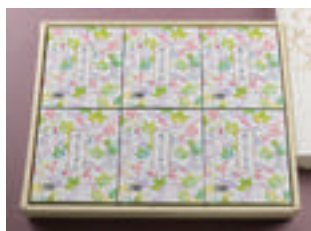
② ざるそば 6人前 3,600円