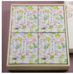
⑩ ざるそば 4人前