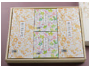
③ ざるそば 2人前 + かけそば 2人前 2,900円