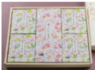
④ ざるそば 4人前 + にしんそば 1人前 3,600円