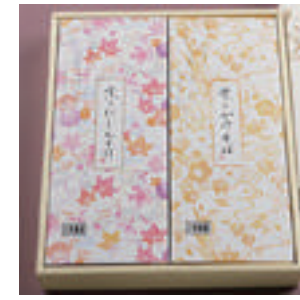
⑬ かけそば 1人前 + にしんそば 1人前