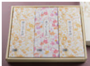
⑧ かけそば 2人前 + にしんそば 1人前 2,830円