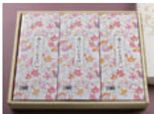
① にしんそば 3人前 3,500円