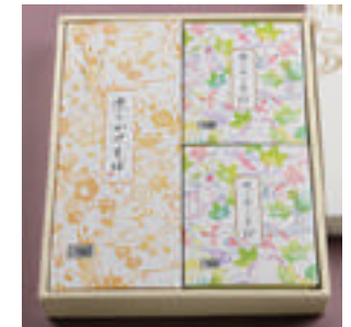
⑭ ざるそば 2人前 + かけそば 1人前