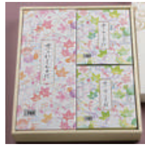
⑫ ざるそば 2人前 + にしんそば 1人前