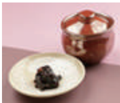
T⑤ そばみそ (60g)